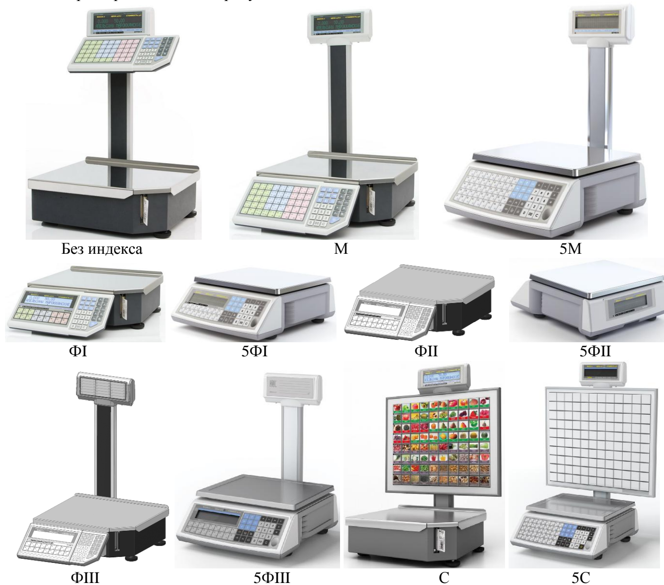
Рисунок 1 - Общий вид весов (индексы: М; 5М, ФI, 5ФI, ФII, 5ФII, ФIII, 5ФIII, С, 5С и без индекса)

Схемы пломбировки от несанкционированного доступа, обозначение места нанесения знака поверки представлены на рисунке 2.