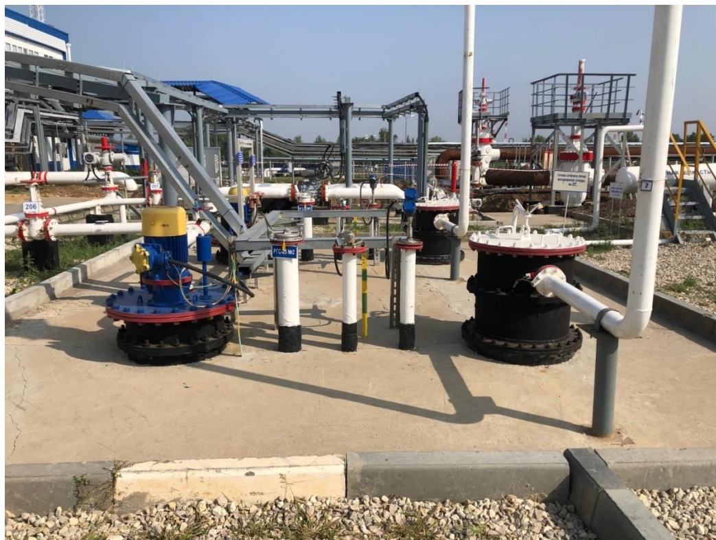
Рисунок 2 – Общий вид надземной части резервуара РГС-25 зав.№ 2