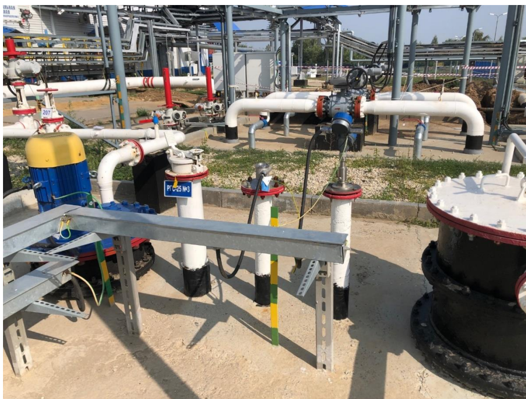
Рисунок 3 – Общий вид надземной части резервуара РГС-25 зав.№ 3

Пломбирование резервуаров не предусмотрено.