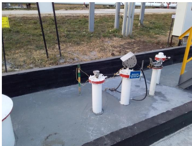
Рисунок 2 – Общий вид надземной части резервуара РГС-60 зав.№ ЕП-3