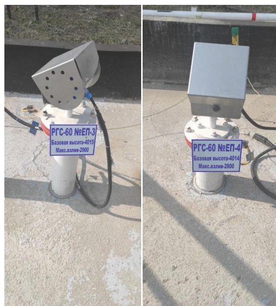
Рисунок 4 – Фотографии табличек с заводскими номерами резервуаров РГС-60 зав.№№ ЕП-3, ЕП-4

Пломбирование резервуаров не предусмотрено.