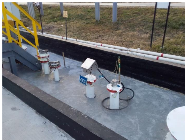
Рисунок 3 – Общий вид надземной части резервуара РГС-60 зав.№ ЕП-4