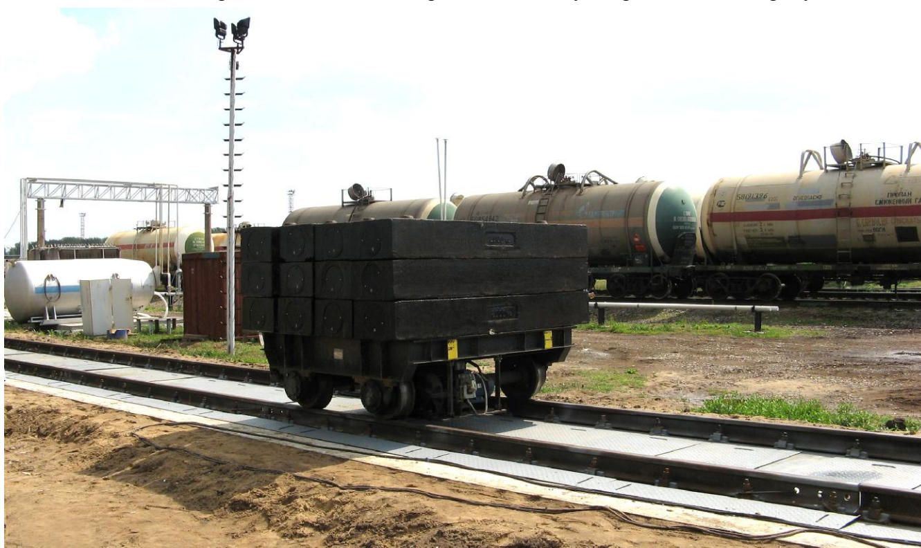
Рисунок 1 - Общий вид ГПУ весов

Схема пломбировки от несанкционированного доступа представлена на рисунке 3.