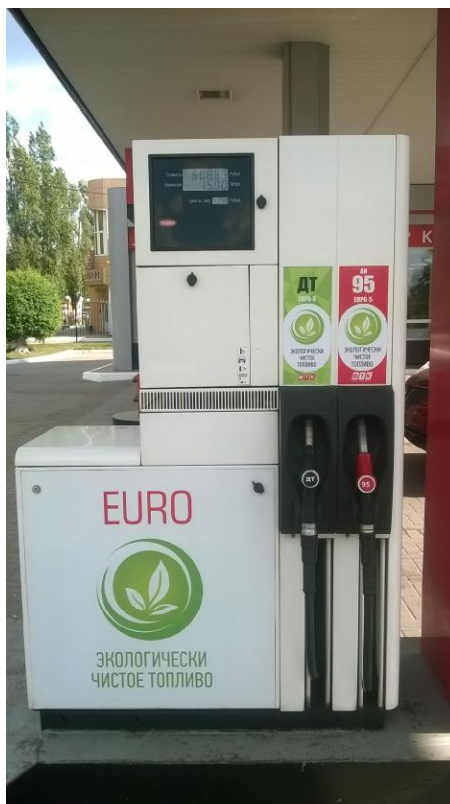
Рисунок 1 – Общий вид колонки

Общий вид колонки приведен на рисунке 1, места пломбирования на рисунках 2 – 3.