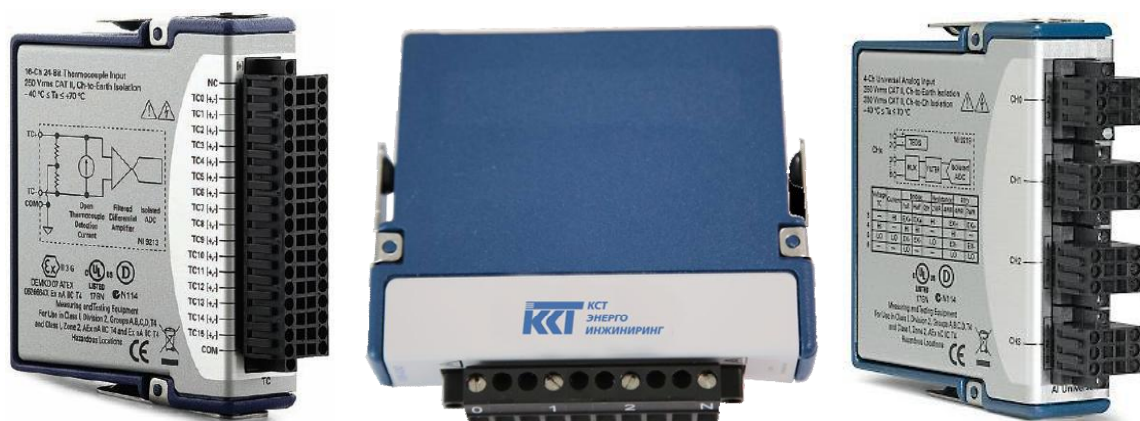
Рисунок 1 - Общий вид модулей ввода/вывода К-АИ219, К-АИ230, К-АИ232, К-АИ242, К-АИ239, К-АИ227, К-ТИ213, К-РИ217 и К-АИ237

Общий вид модулей ввода/вывода представлен на рисунке 1 и 2. Внешний вид шасси с установленными модулями и схема пломбировки от несанкционированного доступа представлены на рисунке 3. Защита от несанкционированного доступа предусмотрена в виде опломбирования модулей, установленных в шасси, разрывной наклейкой, закрепленной поверх фиксирующей защелки.