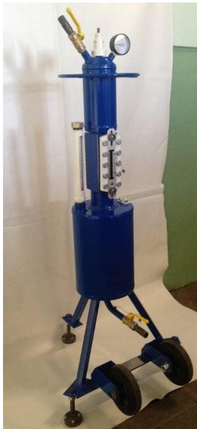
Рисунок 1 - Общий вид мерника металлического 2-го разряда для сжиженных газов ММСГ-1

Общий вид мерника представлен на рисунке 1.