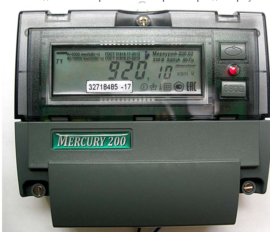
Рисунок 1 - Внешний вид счетчика с закрытой клеммной крышкой

Внешний вид счетчика с закрытой клеммной крышкой приведён на рисунке 1.