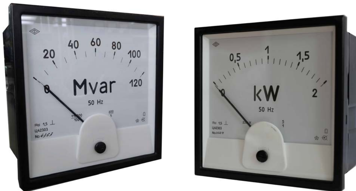
Рисунок 1 - Общий вид ваттметров и варметров Ц42303

Фотографии, общий вид приборов, места нанесения знака поверки, клейм и пломбирования показаны на рисунках 1, 2.