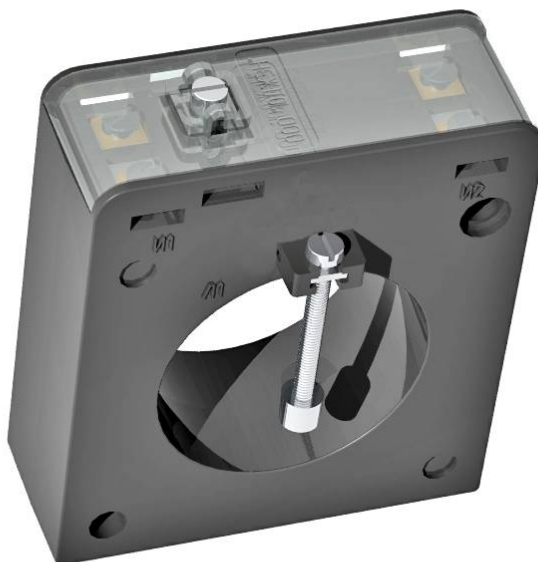
Рисунок 1 – Внешний вид трансформаторов

Места нанесения оттиска знака поверки, знака поверки в виде клейма-наклейки и пломбирования приведены на рисунке 2.