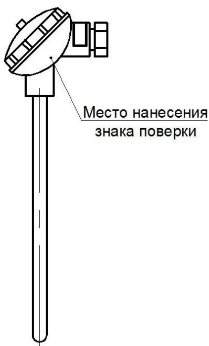
Рисунок 6 - Место нанесения знака поверки