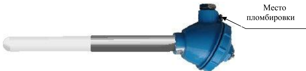
Рисунок 5 - Внешний вид преобразователей термоэлектрических ТЖК(Ж)-1199, ТХА(К)-1199, ТХК(Л)-1199, ТНН(Н)-1199, ТПП(С)-1199, ТПП(Р)-1199, ТПР(В)-1199 исполнения 34