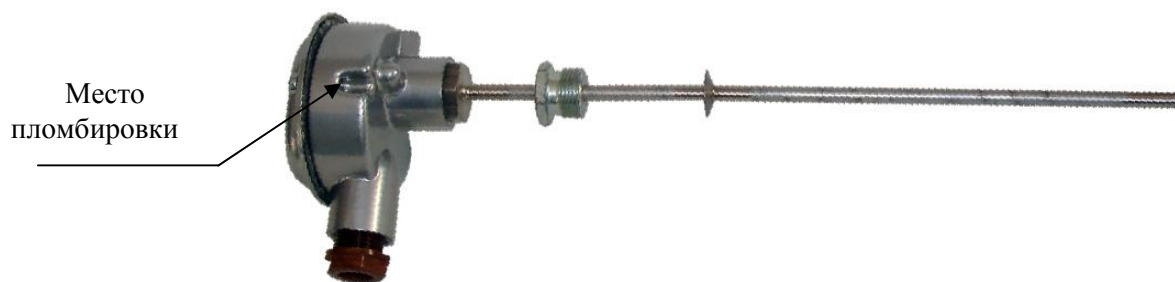
Рисунок 3 - Внешний вид преобразователей термоэлектрических ТЖК(Ж)-1199, ТХА(К)-1199, ТХК(Л)-1199, ТНН(Н)-1199 исполнения 71