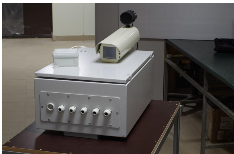
Рисунок 2 - Общий вид средства измерений

Геометрические параметры «зоны контроля», а также координаты установки комплекса определяются после установки комплекса на месте эксплуатации при первичной поверке.