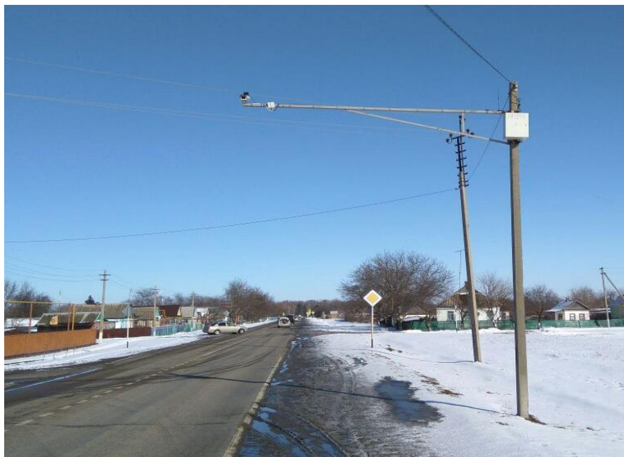
Рисунок 1 - Пример установки средства измерений

Вычислительный модуль со встроенным ПО обеспечивает работоспособность и функционирование всех узлов комплекса; нанесение даты и времени, а также координат на каждый кадр с видеодатчика, математическую обработку поступающих данных, анализ изображений, распознавание ТС и ГРЗ ТС; измерение скорости ТС; выявление фактов нарушений, ведение базы данных событий, формирование доказательных материалов; осуществление хранения, архивирования и передачи данных.