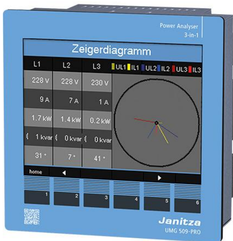
Рисунок 5 - Общий вид приборов UMG 509-PRO