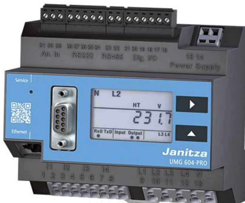
Рисунок 8 - Общий вид приборов UMG 604-PRO