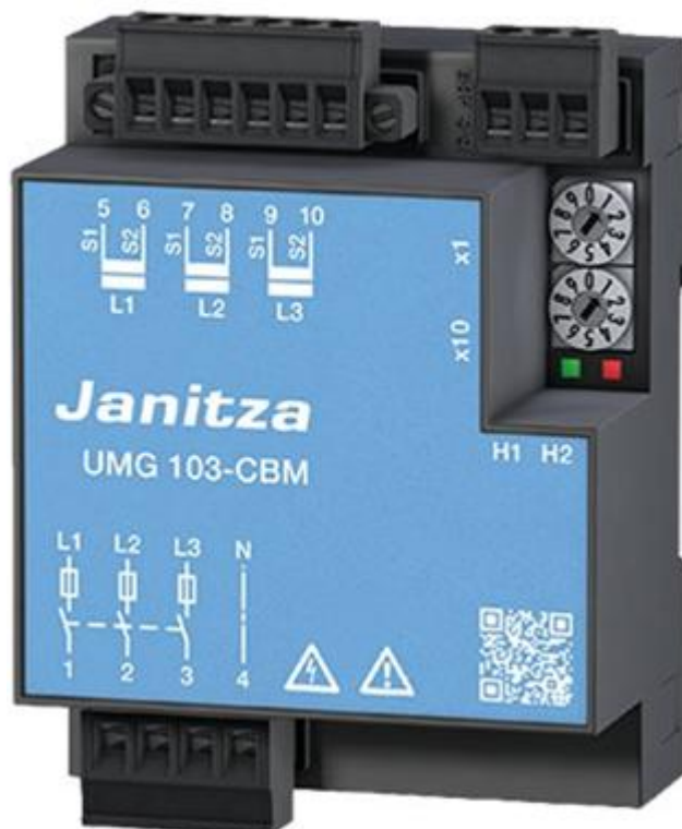
Рисунок 3 - Общий вид приборов UMG 103-CBM