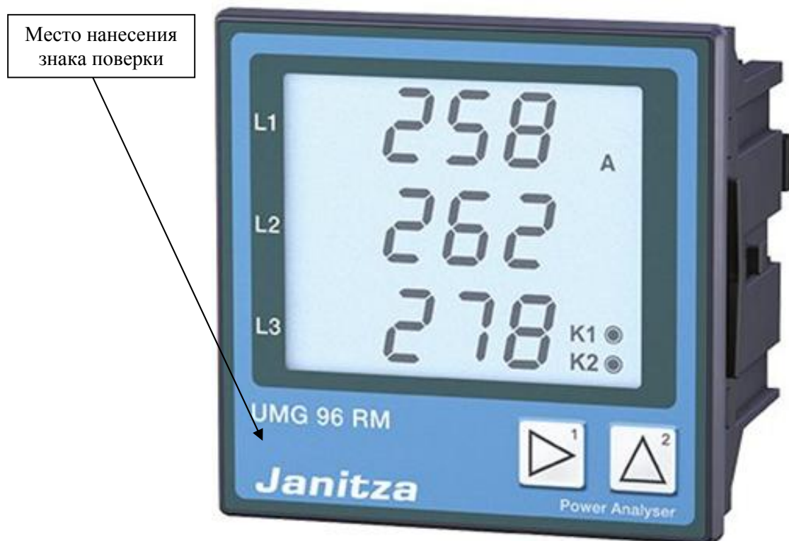
Рисунок 2 - Общий вид приборов UMG 96 RM, UMG 96 RM-CBM, UMG 96 RM-E, UMG 96 RM-EL, UMG 96 RM-M, UMG 96 RM-P, UMG 96 RM-PN