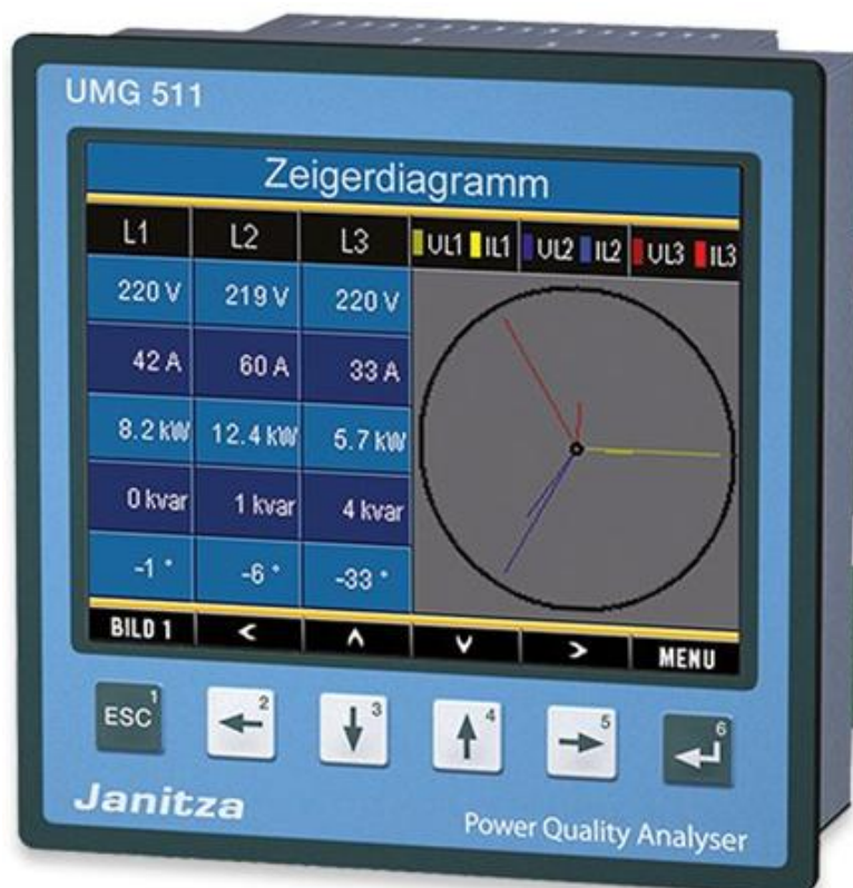
Рисунок 6 - Общий вид приборов UMG 511UL