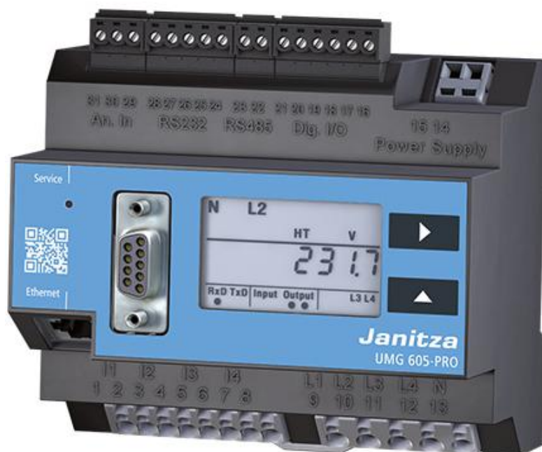
Рисунок 9 - Общий вид приборов UMG 605-PRO