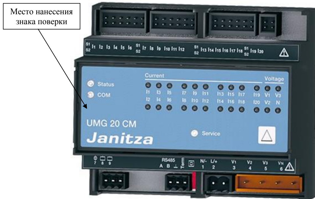
Рисунок 1 - Общий вид приборов UMG 20 CM

Схема пломбировки от несанкционированного доступа представлена на рисунке 10. Знак поверки наносится на лицевую панель корпуса прибора.