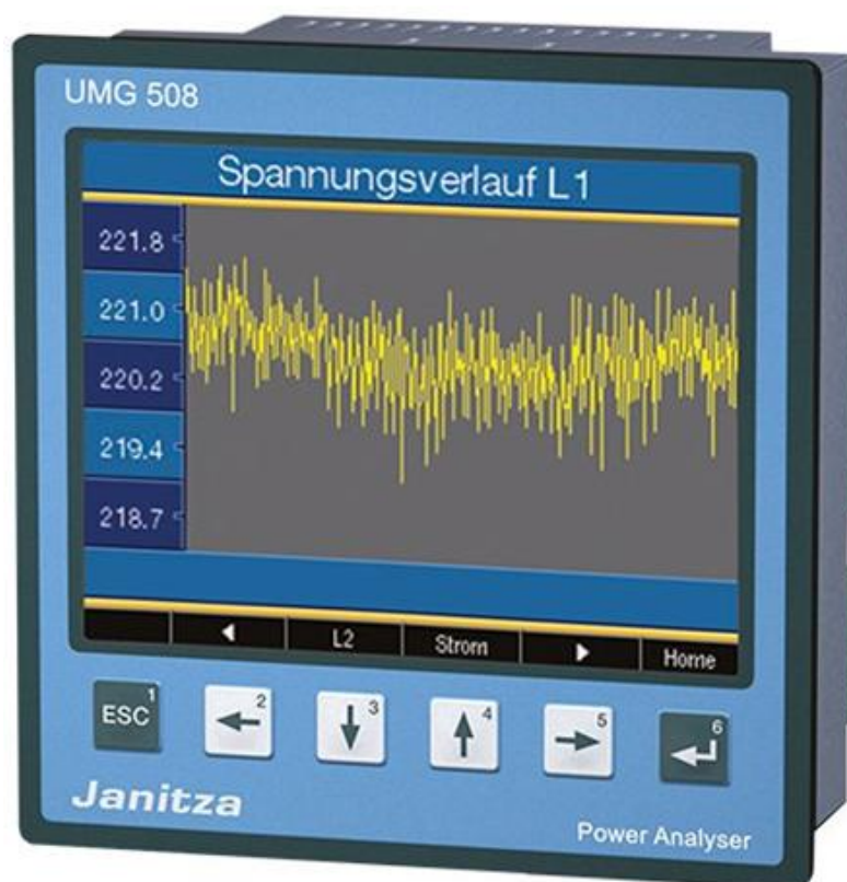
Рисунок 4 - Общий вид приборов UMG 508UL