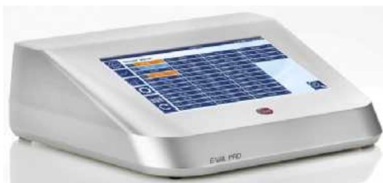
Рисунок 1 - Общий вид основного модуля

Пломбирование систем измерений многоканальных E-Val Pro не предусмотрено.