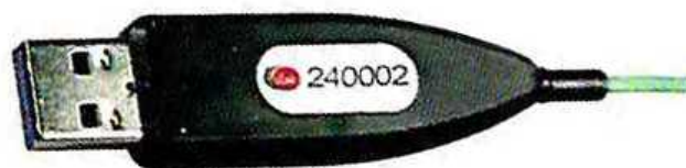
Рисунок 17 - Общий вид USB-коннектора датчиков температуры и давления