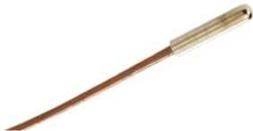
Рисунок 12 - Общий вид первичного преобразователя модели STC-KT