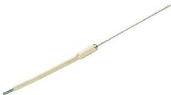
Рисунок 6 - Общий вид первичного преобразователя модели SSS