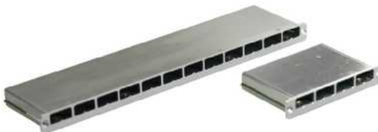
Рисунок 19 - Общий вид 12-ти и 4-х канальных блоков для подключения датчиков