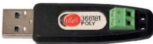
Рисунок 16 - Общий вид аналого-цифрового датчика для подключения термопар типов «К», «J», «N», «R»