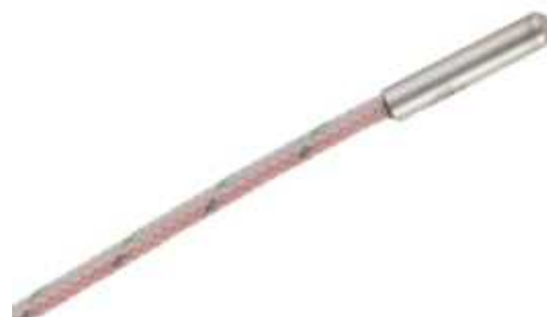
Рисунок 11 - Общий вид первичного преобразователя модели STC-AC