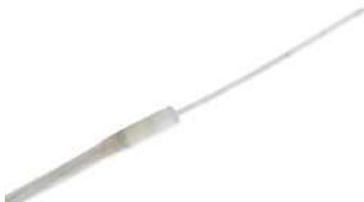
Рисунок 10 - Общий вид первичного преобразователя модели SD4