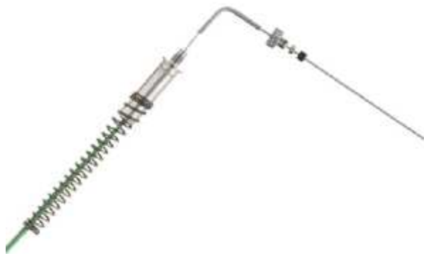
Рисунок 4 - Общий вид первичного преобразователя модели SSV