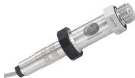
Рисунок 13 - Общий вид датчика давления