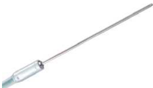
Рисунок 8 - Общий вид первичного преобразователя модели SSR