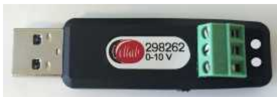
Рисунок 18 - Общий вид аналого-цифрового датчика напряжения постоянного тока