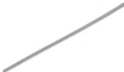
Рисунок 9 - Общий вид первичного преобразователя модели SSU-MM