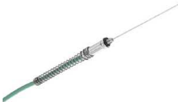
Рисунок 2 - Общий вид первичного преобразователя модели SSA-TS