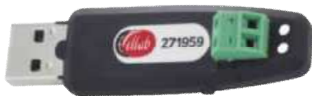
Рисунок 14 - Общий вид аналого-цифрового датчика для подключения термопар типа «Т»