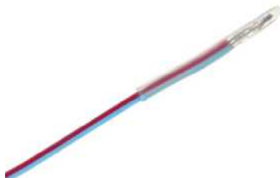
Рисунок 5 - Общий вид первичного преобразователя модели STC22-TF