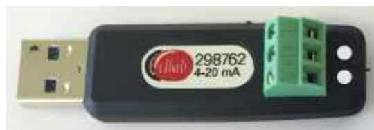
Рисунок 15 - Общий вид аналого-цифрового датчика силы постоянного тока