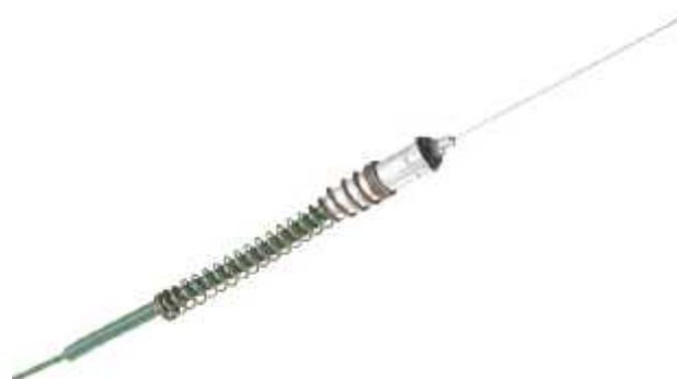
Рисунок 3 - Общий вид первичного преобразователя модели SSA-TF