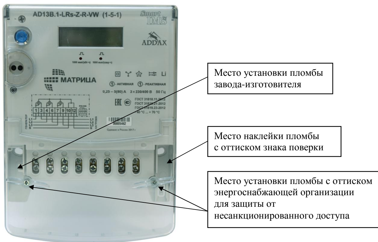
Рисунок 2 - Общий вид счетчика и схема пломбировки от несанкционированного доступа в корпусе типа «классический тонкий», разрушаемом при вскрытии