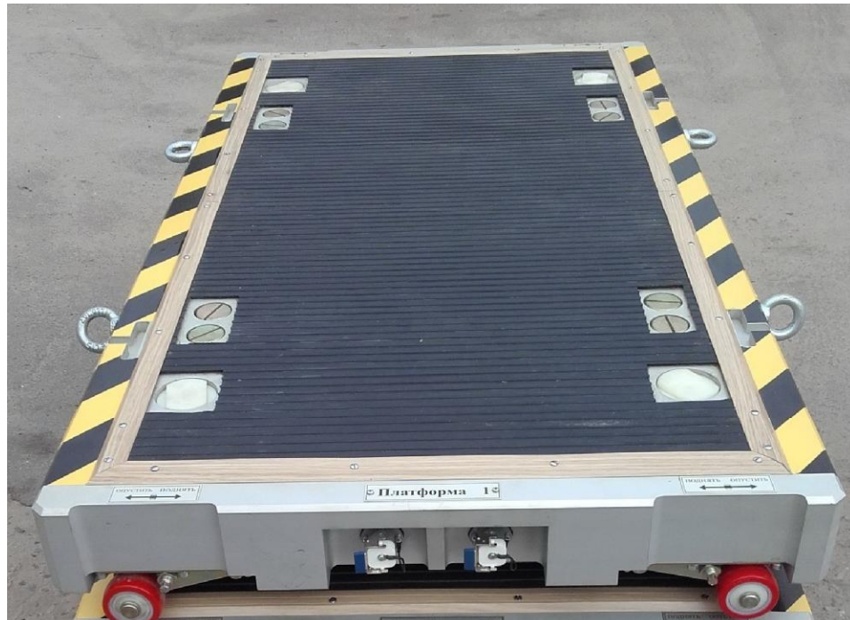
Рисунок 1 - Общий вид весоизмерительной платформы

Масса определяется как сумма показаний всех весоизмерительных платформ и индицируется на индикаторном табло приборного блока.