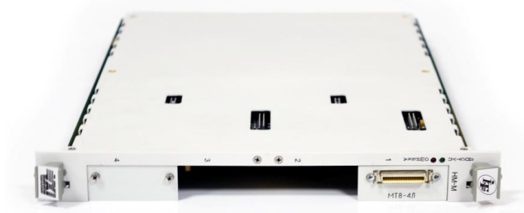
Рисунок 3 - Схема пломбировки от несанкционированного доступа измерителей, установленных в носитель мезонинных модулей