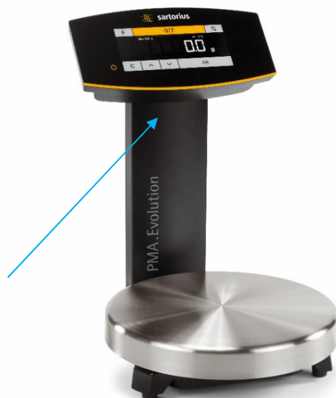
Рисунок 1 - Общий вид весов неавтоматического действия PMA

На рисунке 1 стрелкой обозначено место нанесения знака поверки в виде наклейки.