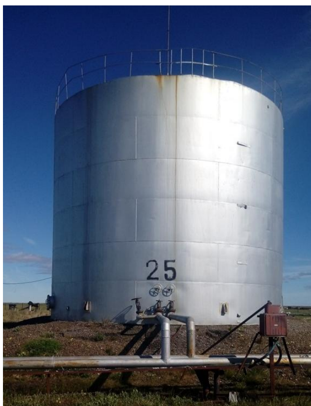
Рисунок 1 - Общий вид резервуара РВС-700

Общий вид резервуаров стальных вертикальных цилиндрических РВС-700, РВС-2000, РВС-3000 представлен на рисунках: 1, 2, 3.