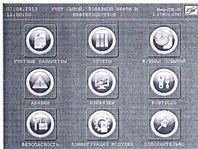
Рисунок 1 – Идентификационные данные ПО

8.5.1.2 Проверку идентификационного наименования и номера версии ПО ИВК проводят сравнением данных, приведённых в 8.5.1.1 настоящей МП и отображаемых в верхнем правом углу главного окна дисплея ИВК (рисунок 1).