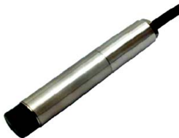
Рисунок 2 - Общий вид датчиков серии Hydrosens