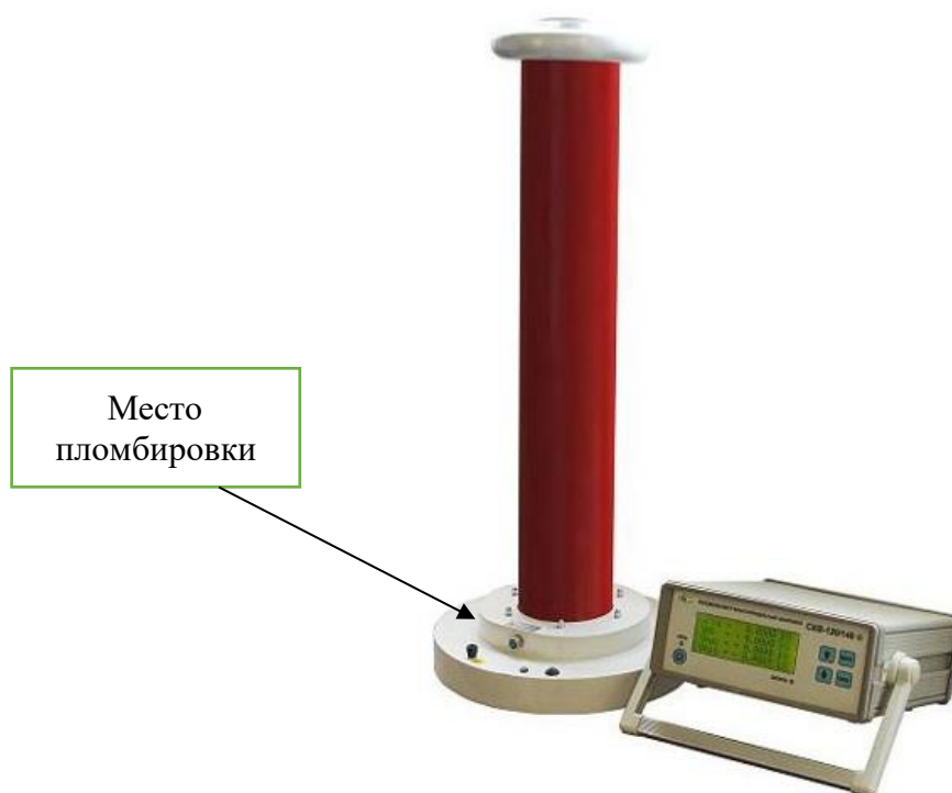
Рисунок 2 - Общий вид и обозначение мест пломбировки от несанкционированного доступа модификаций ПКВТ СКВ-120/140-0,25, ПКВТ СКВ-120/140-0,5, ПКВТ СКВ-120/140-1,0