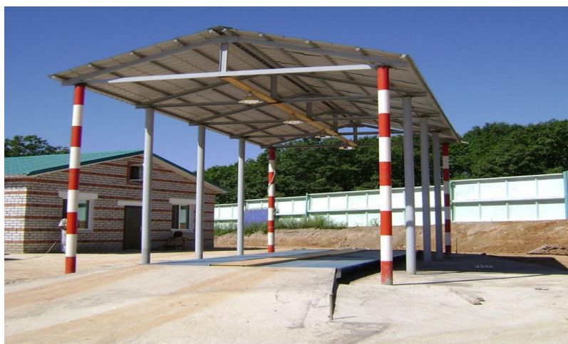
Рисунок 1 – Общий вид весов МАГНУС

Общий вид весов представлен на рисунке 1.