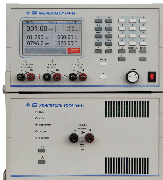
Рисунок 1 – Общий вид калибратора

Схема пломбировки от несанкционированного доступа представлена на рисунке 3.