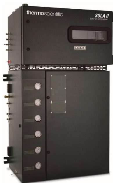
Рисунок 1 – Общий вид анализаторов общей серы в нефтепродуктах промышленных модели SOLA II и модификации SOLA II Trace

Пломбирование анализаторов общей серы в нефтепродуктах промышленных модели SOLA II, SOLA II Flare и модификации SOLA II Trace предусмотрено.