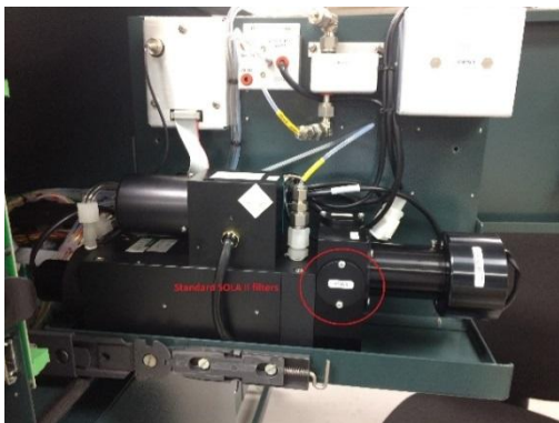
Рисунок 3 – Общий вид анализатора общей серы в нефтепродуктах промышленного модели SOLA II в открытом виде