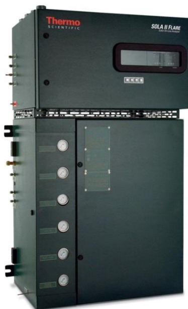
Рисунок 5 – Общий вид анализатора общей серы в нефтепродуктах промышленного модели SOLA II Flare