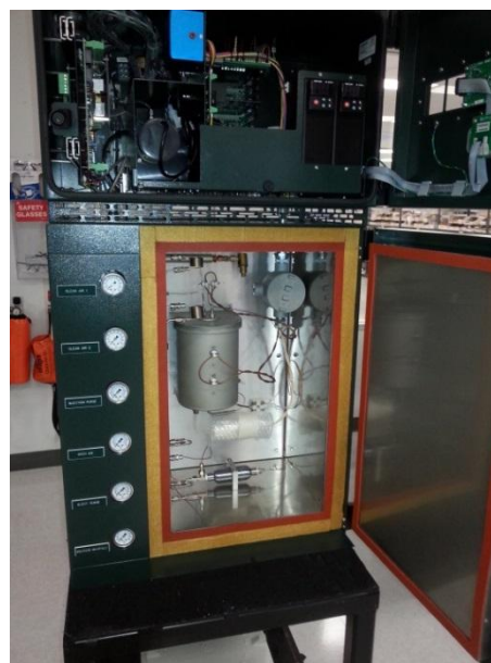
Рисунок 2 – Общий вид анализаторов общей серы в нефтепродуктах промышленных модели SOLA II и модификации SOLA II Trace в открытом виде