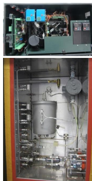
Рисунок 6 – Общий вид анализатора общей серы в нефтепродуктах промышленного модели SOLA II Flare в открытом виде