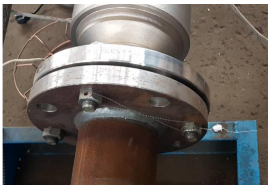
Рисунок 3 – Пломба поверителя, препятствующая демонтажу счетчика