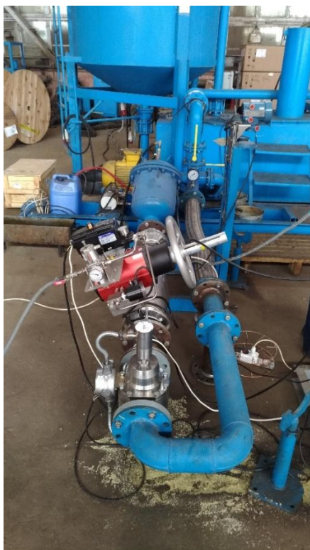
Рисунок 1 – Общий вид комплекса

Для исключения возможности непреднамеренных и преднамеренных изменений измерительной информации, счетчик, входящий в состав комплекса, пломбируются в соответствии с эксплуатационной документацией на него. Схемы пломбировки комплекса от несанкционированного доступа представлены на рисунках 2 - 3.