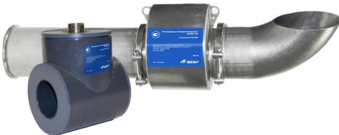
Рисунок 1 – Общий вид расходомеров-счетчиков электромагнитных ВЗЛЕТ СК

Пломбировка от несанкционированного доступа расходомеров-счетчиков электромагнитных ВЗЛЕТ СК осуществляется нанесением знака поверки давлением на свинцовую (пластмассовую) пломбу, установленную на контрольной проволоке, пропущенную через пломбировочные отверстия винтов крепления разъема на корпусе расходомера-счетчика электромагнитного ВЗЛЕТ СК. Схема пломбировки от несанкционированного доступа, обозначение места нанесения знака поверки представлена на рисунке 2.