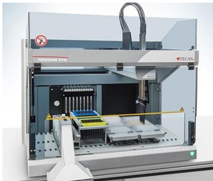
Рисунок 1 – Анализатор автоматический модульный FREEDOM EVO модель FREEDOM EVO 75

Общий внешний вид анализаторов показан на рисунках 1 – 4; место пломбировки анализаторов – на рисунке 2.