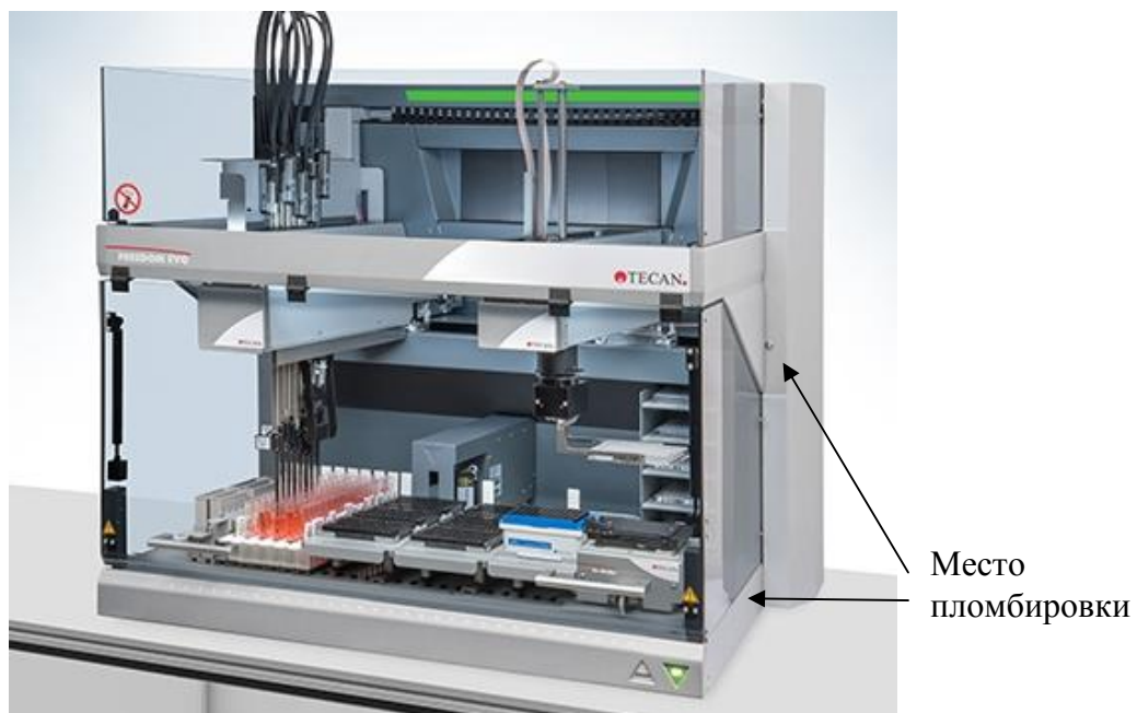
Рисунок 2 – Анализатор автоматический модульный FREEDOM EVO модель FREEDOM EVO-2 100 Base