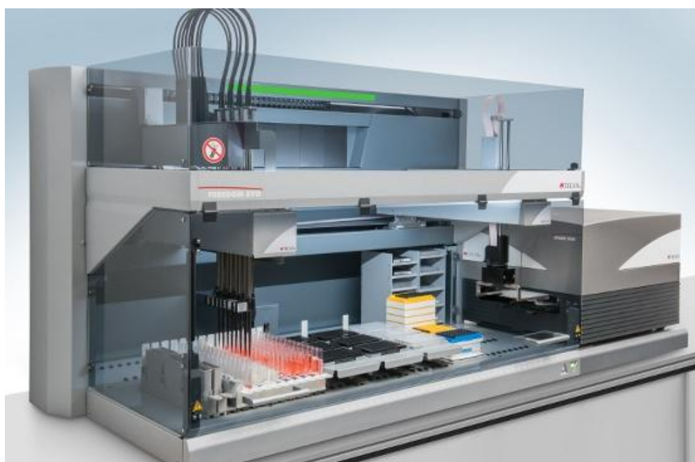
Рисунок 3 – Анализатор автоматический модульный FREEDOM EVO модель FREEDOM EVO-2 150 Base