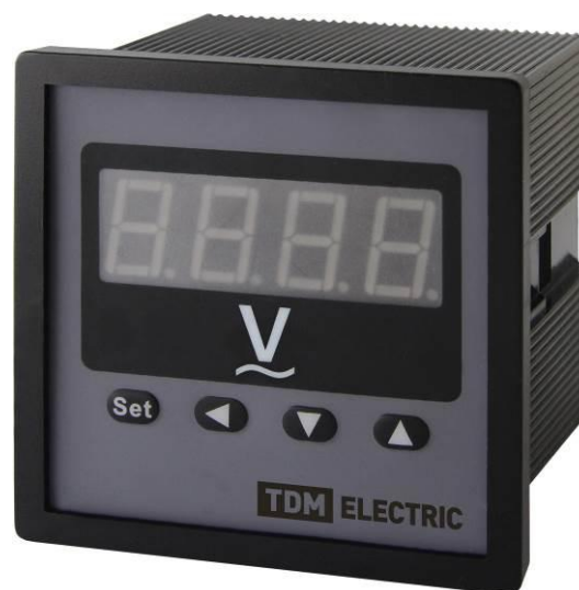
Рисунок 5 – Общий вид приборов ЦП-В72