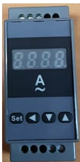
Рисунок 2 – Общий вид приборов ЦП-А45Д