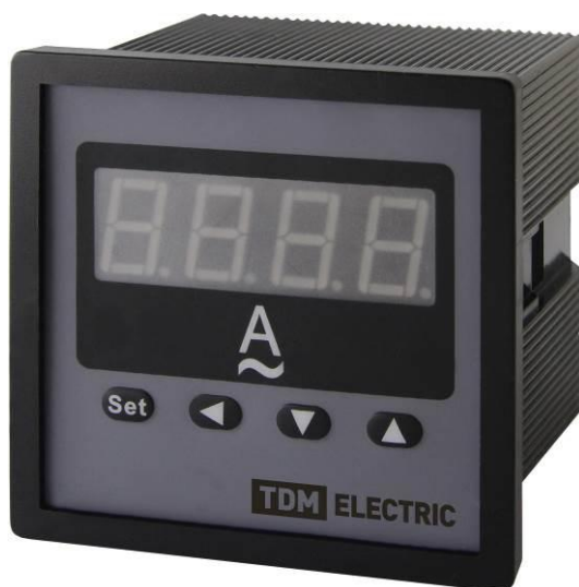
Рисунок 4 – Общий вид приборов ЦП-А72