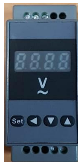
Рисунок 3 – Общий вид приборов ЦП-В45ПД