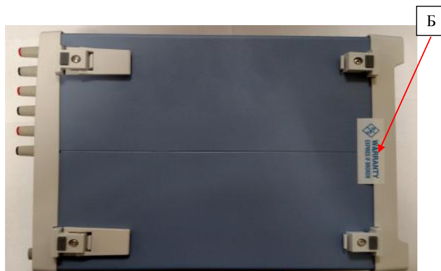
Рисунок 3 – Схема пломбирования источников (Б)