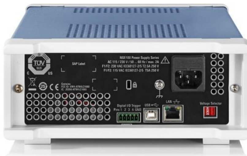
Рисунок 2 – Вид задней панели источников