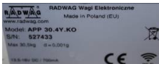
Рисунок 4 – Маркировка компаратора массы