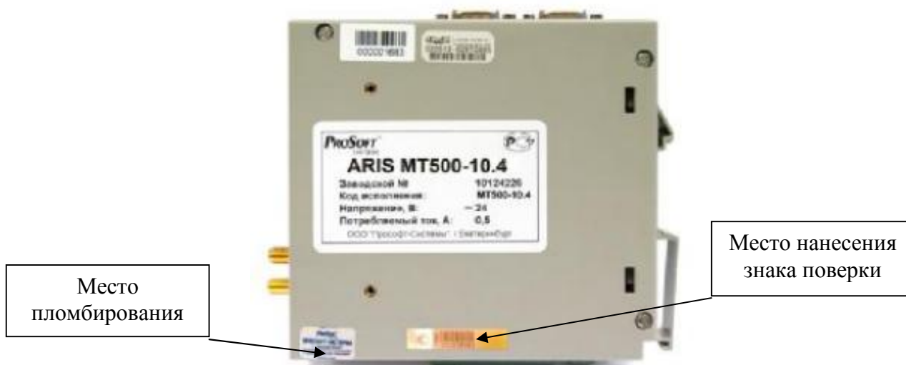
Рисунок 1 – Общий вид контроллеров с указанием мест пломбирования от несанкционированного доступа и нанесения знака поверки