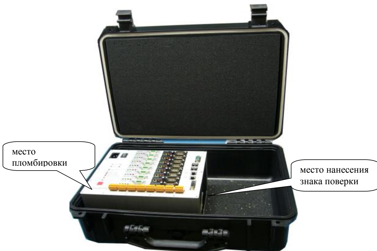
Рисунок 1 - Общий вид регистратора аварийных событий «ТрансАУРА»

Общий вид регистраторов, схема пломбирования для защиты от несанкционированного доступа, обозначение места нанесения знака поверки представлены на рисунках 1 и 2.