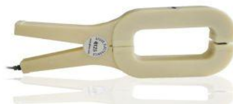
Рисунок 3 - Общий вид токовых клещей