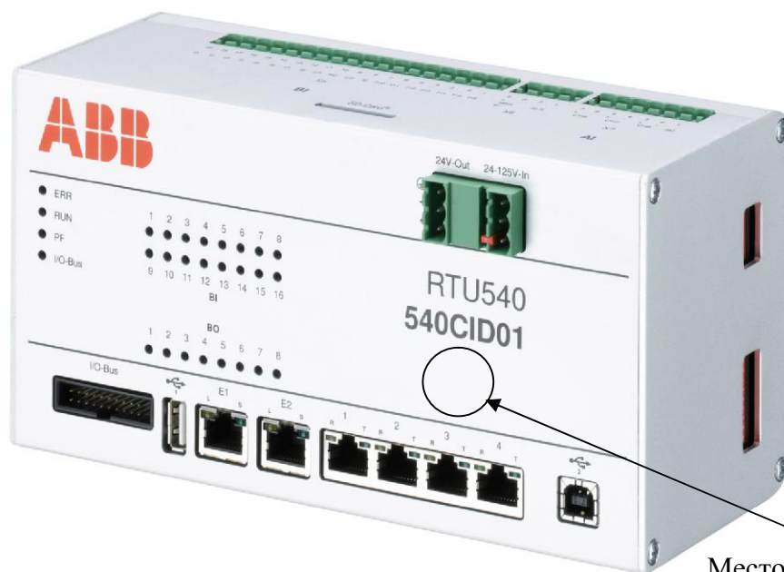
Место нанесения знака поверки