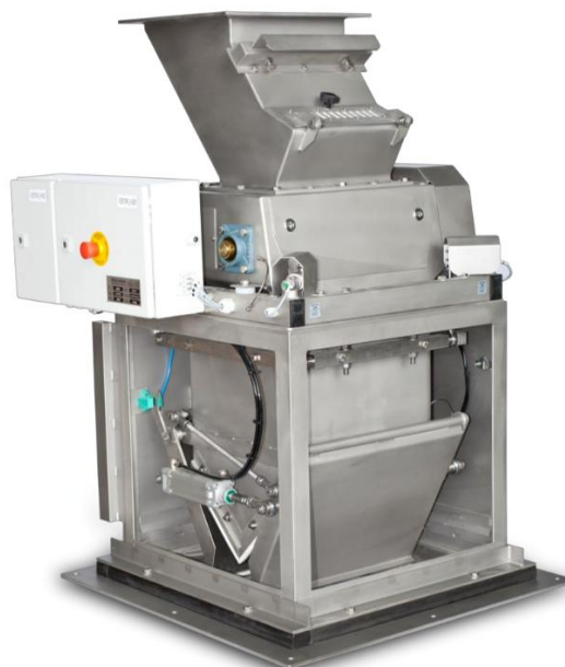
Рисунок 1 - Общий вид весов автоматических SIWAREX FTA, Net Weigher SB

Общий вид весов автоматических SIWAREX FTA, Net Weigher SB представлен на рисунке 1.