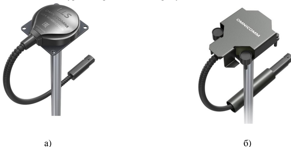
Рисунок 1 – Общий вид датчиков уровня топлива Omnicomm LLS 4, LLS Military Edition

где XXXX – длина измерительной части чувствительного элемента датчика уровня, мм. Общий вид датчиков уровня представлен на рисунке 1.