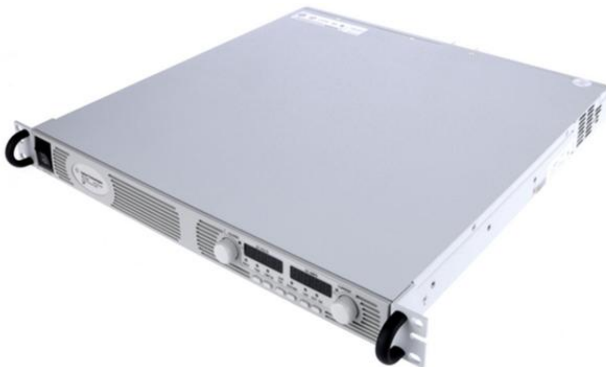
Рисунок 1 – Общий вид источников питания постоянного тока серии N5700. Вид спереди