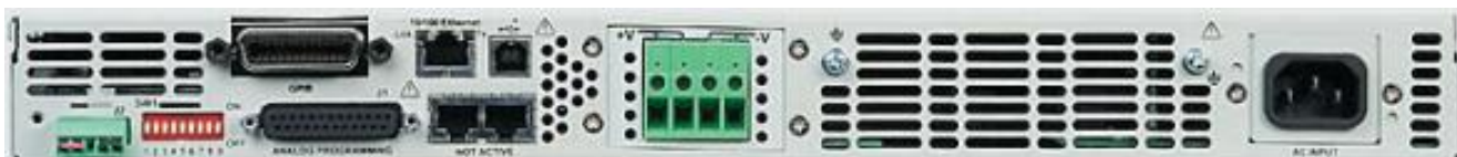
Рисунок 5 – Общий вид источников питания постоянного тока серии N5700. Вид задней панели источников с выходным напряжением 600 В и мощностью до 780 Вт