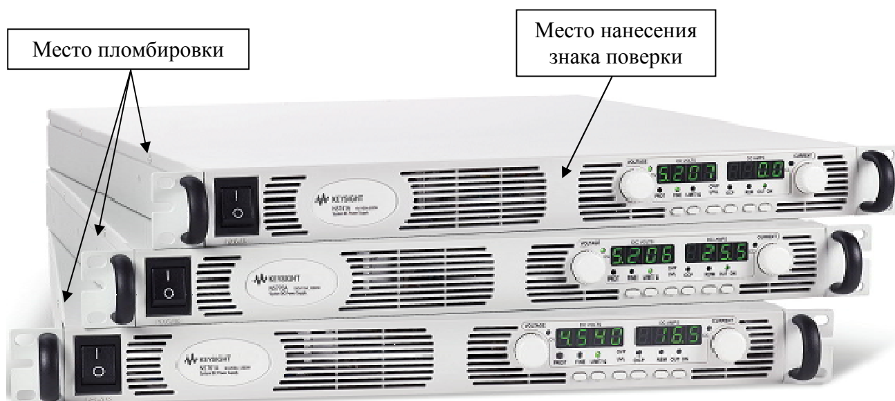
Рисунок 8 – Схема пломбировки от несанкционированного доступа, обозначение места нанесения знака поверки