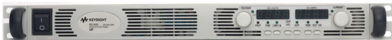
Рисунок 3 – Общий вид источников питания постоянного тока серии N5700. Вид передней панели