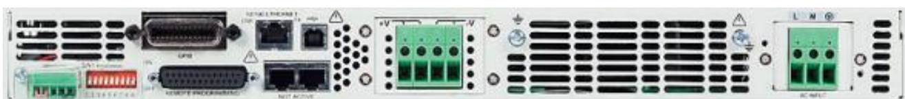
Рисунок 7 – Общий вид источников питания постоянного тока серии N5700. Вид задней панели источников с выходным напряжением 600 В и мощностью до 1560 Вт