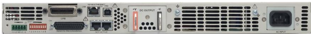
Рисунок 4 – Общий вид источников питания постоянного тока серии N5700. Вид задней панели источников с выходным напряжением 60 В и мощностью до 780 Вт