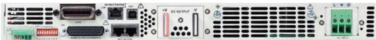
Рисунок 6 – Общий вид источников питания постоянного тока серии N5700. Вид задней панели источников с выходным напряжением 60 В и мощностью до 1560 Вт