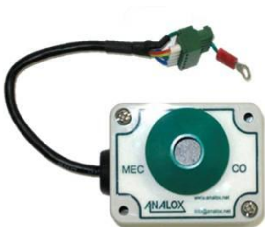
в) датчик MEC CO