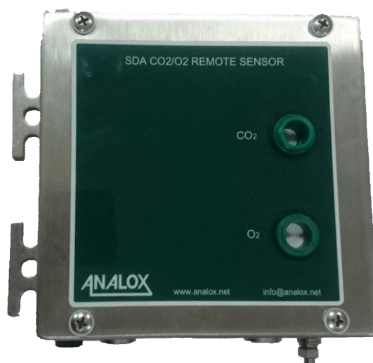
г) датчик SDA CO 2 /O 2