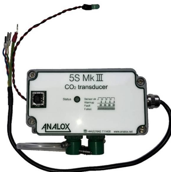
д) CO 2 Transducer 5S Mk III