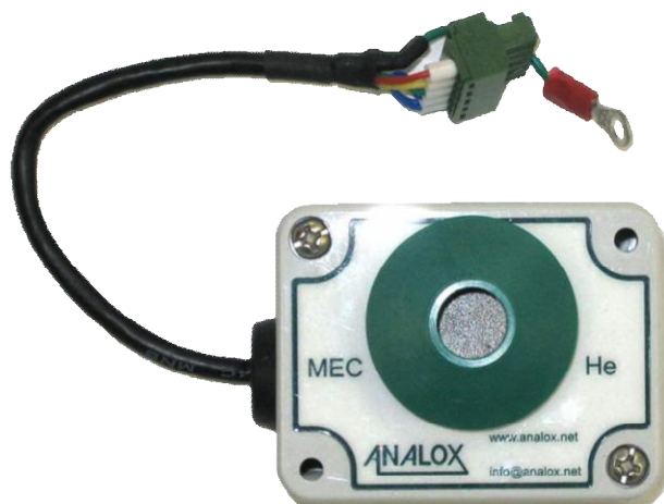
б) датчик MEC He