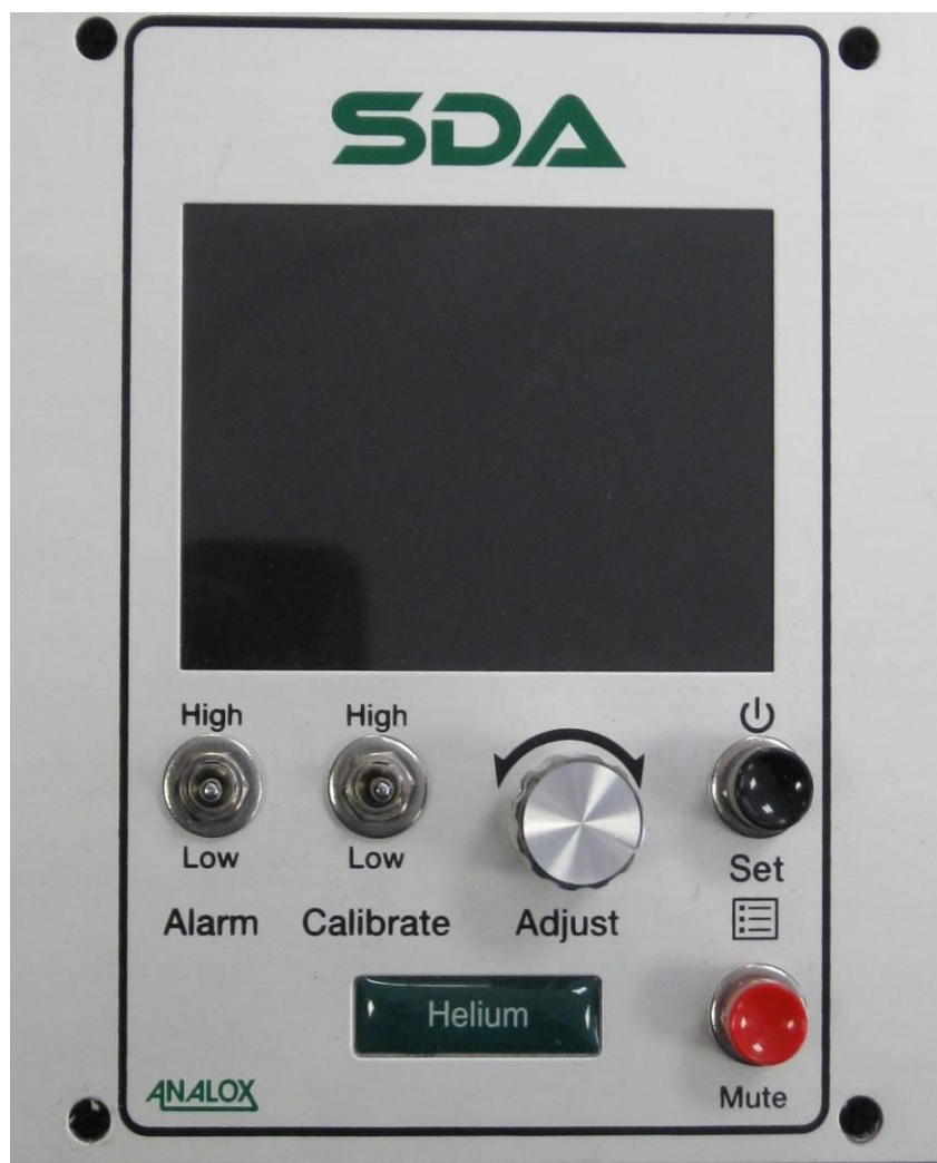
Рисунок 1 – Общий вид газоанализаторов, SDA монитор (на примере SDA монитор He, внешний вид остальных SDA мониторов аналогичен)