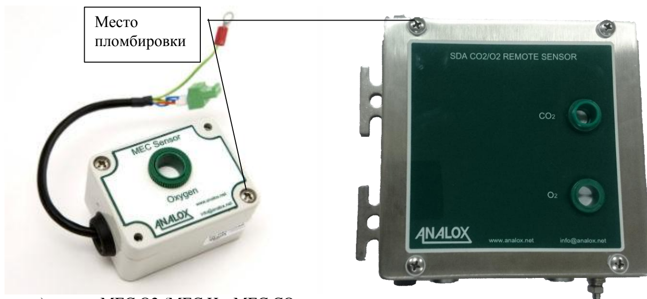
а) датчик MEC O 2 (MEC He, MEC CO - аналогично)