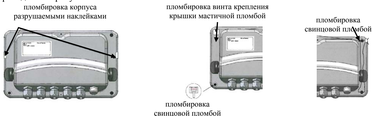
Рисунок 3 — Схема пломбировки приборов весоизмерительных i 30, i 35

Знак поверки в виде наклейки наносится на лицевую панель прибора весоизмерительного. Примеры схем пломбировки от несанкционированного доступа клемм подсоединений сигнальных кабелей датчиков, расположенных внутри корпуса индикатора приведены на рисунках 3 — 5.