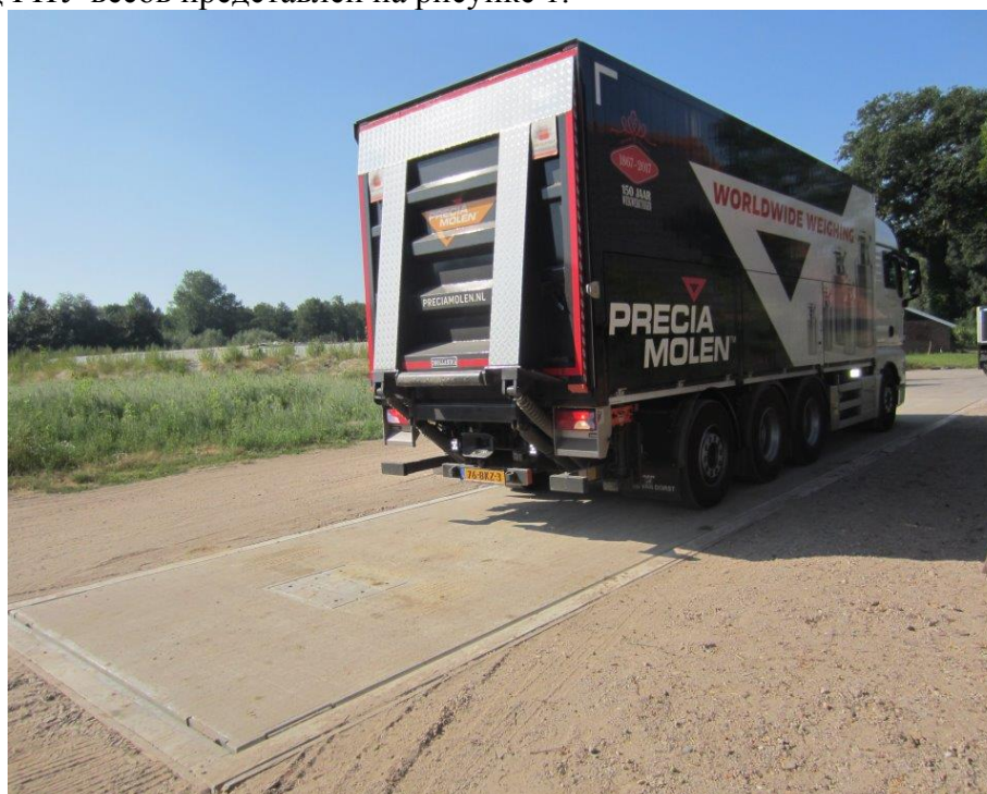
Рисунок 1 — Общий вид ГПУ весов

Общий вид ГПУ весов представлен на рисунке 1.