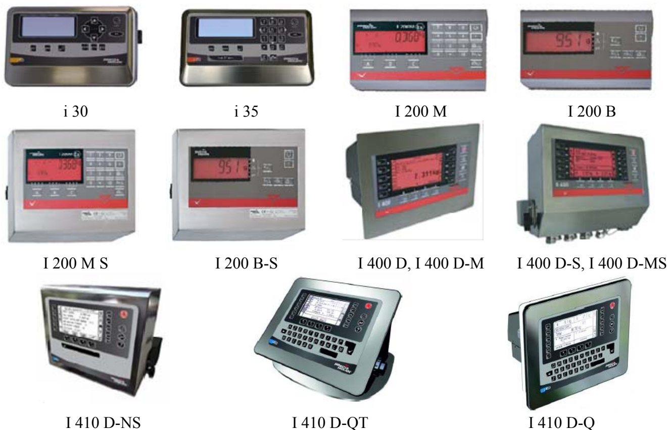
Рисунок 2 — Общий вид индикаторов

Весы снабжены следующими устройствами и функциями (в скобках указаны соответствующие пункты ГОСТ OIML R 76-1–2011):