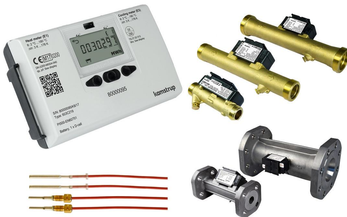
Рисунок 1 - Общий вид теплосчетчика MULTICAL® 603

Схема пломбировки от несанкционированного доступа, обозначение места нанесения знака поверки представлены на рисунке 2.