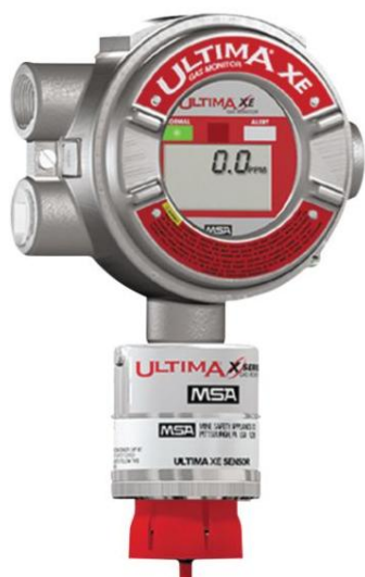
а) Газоанализатор модификации ULTIMA XE