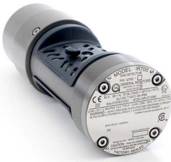
Рисунок 6 – Общий вид газоанализаторов стационарных IR700