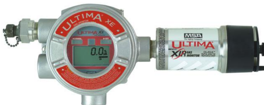
б) Газоанализатор модификации ULTIMA XIR