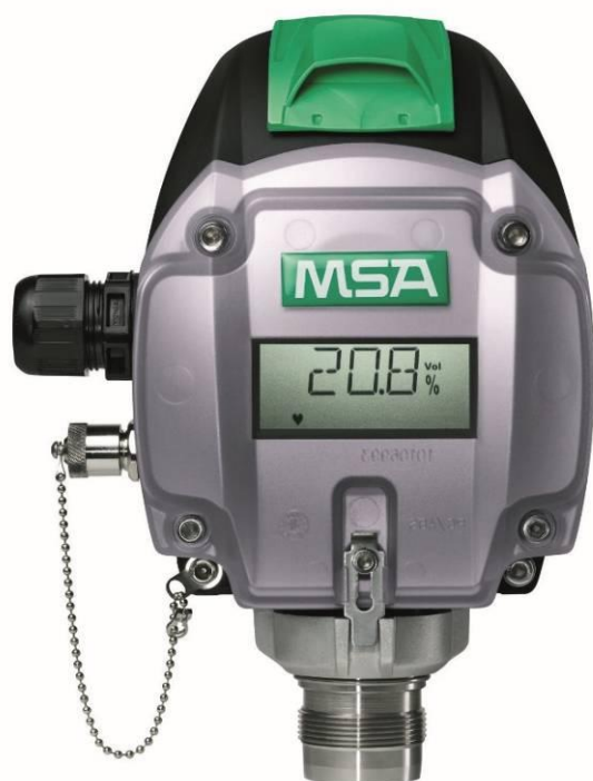
Рисунок 2 – Общий вид газоанализаторов серии ULTIMA X модификаций ULTIMA XE, ULTIMA XIR