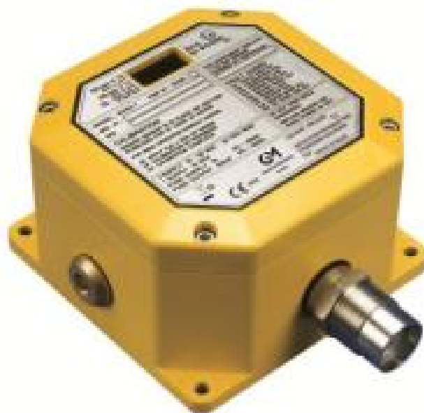
б) модель S4100T