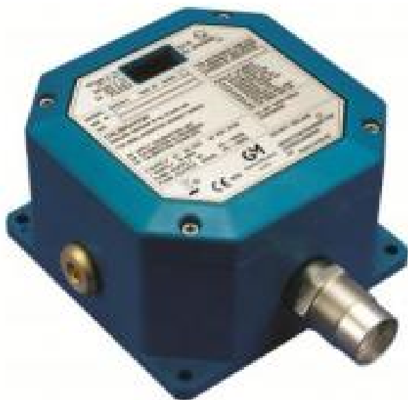
а) модель S4100C