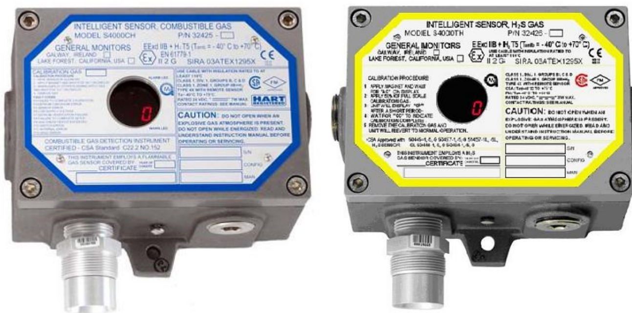
а) модель S4000CH