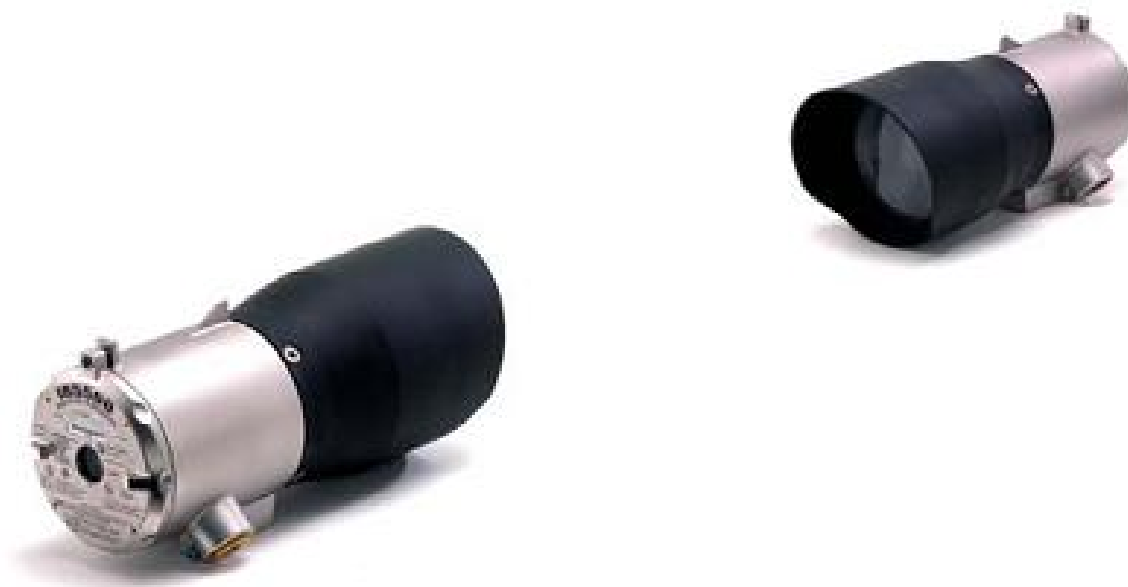
Рисунок 7 – Общий вид газоанализаторов углеводородных газов трассовых IR5500