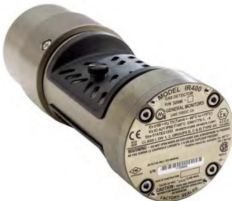
Рисунок 5 – Общий вид газоанализаторов углеводородных газов стационарных модели IR400