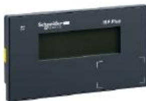
Рисунок 2 - Фотография цифрового дисплея

Фотография цифрового дисплея представлена на рисунке 2.