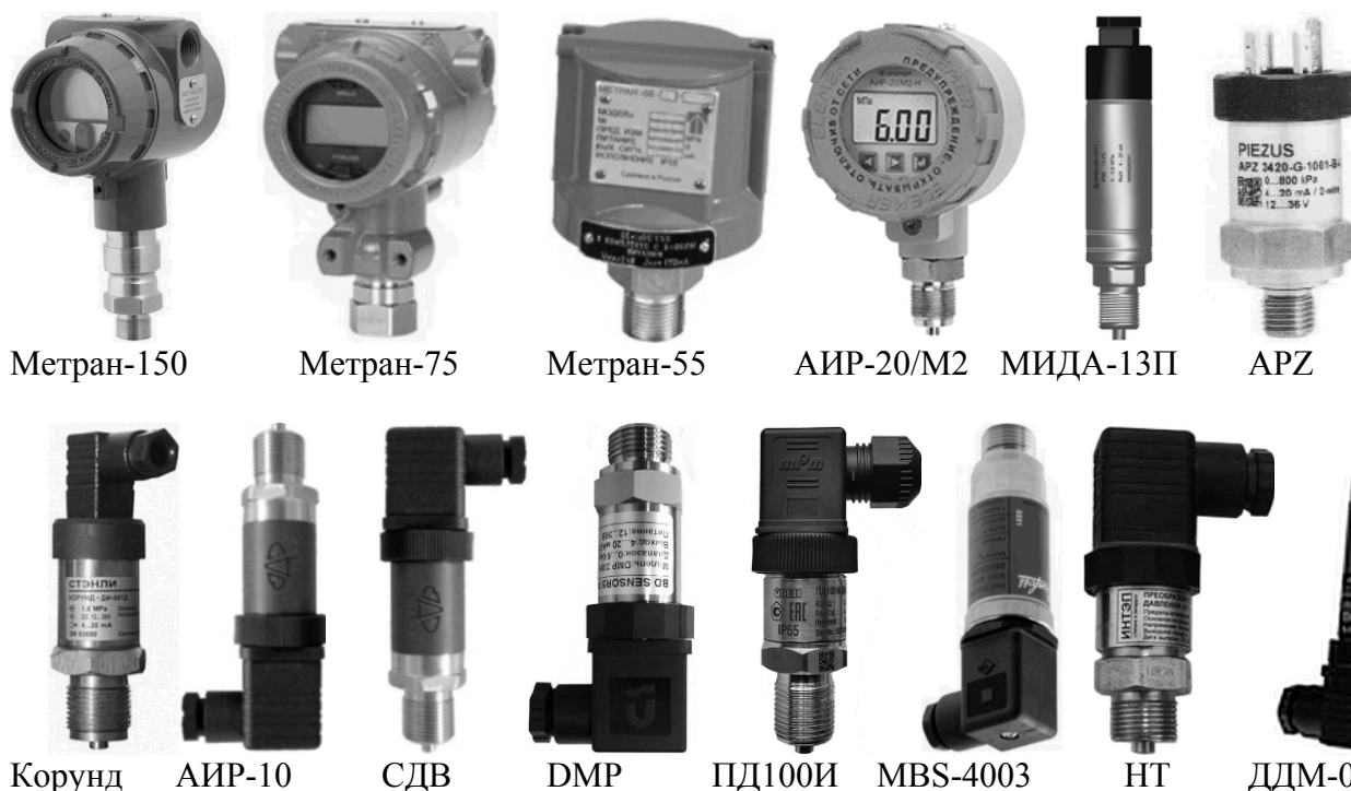
Рисунок 4 – Преобразователи давления