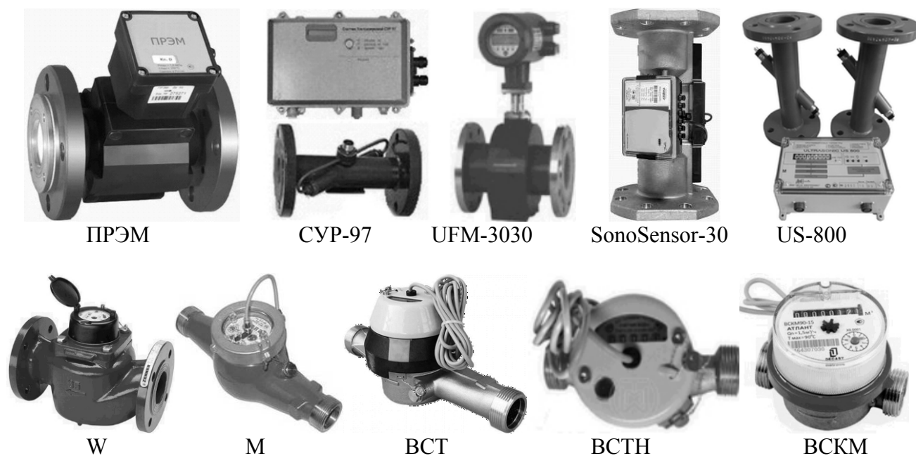
Рисунок 3 – Преобразователи расхода