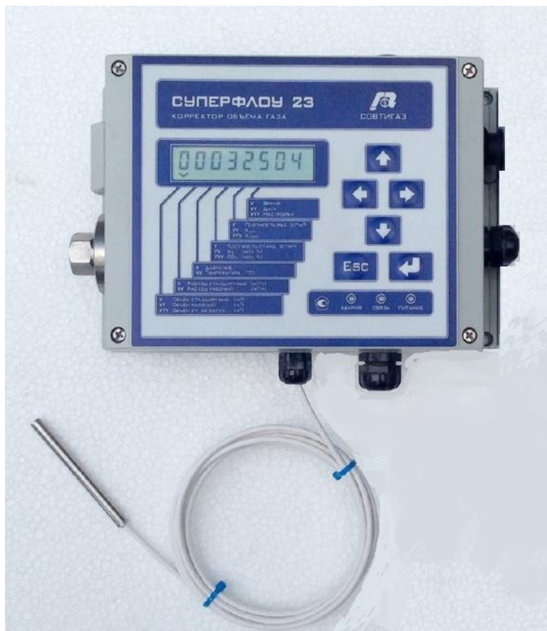
Рисунок 1 – Общий вид корректоров объема газа «Суперфлоу 23В»