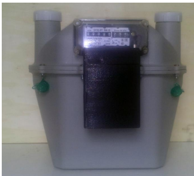
Общий вид счетчиков газа CGD-3T-xR-x-Gx