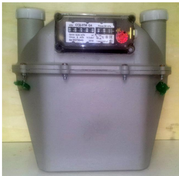
б) Общий вид счетчиков газа CGD-3T-xИ-x-Gx