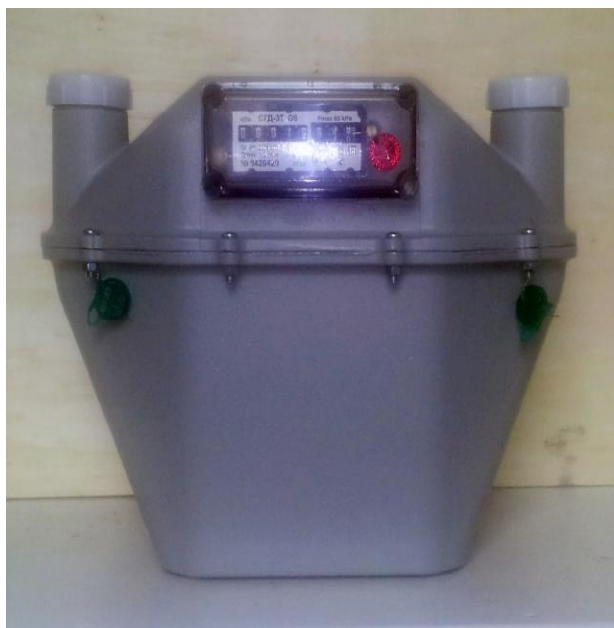
а) Общий вид счетчиков газа CGD-3T-x-x-Gx