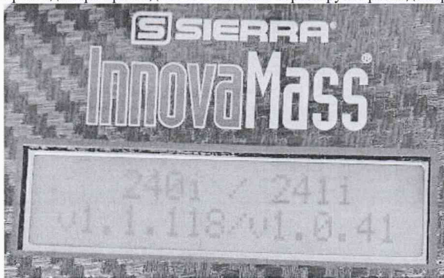
Рисунок 1. Отображение версии ПО

6.3.1. Идентификация ПО осуществляется проверкой его идентификационных данных. Идентификация осуществляется по номеру версии. Номер версии встроенного ПО выводится на дисплей расходомера при подаче питания или перезагрузке расходомера.