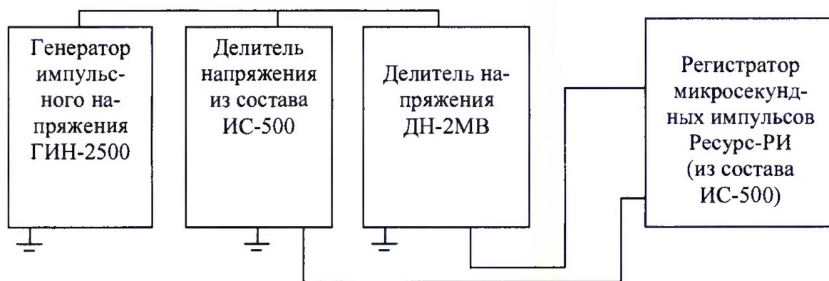
Рисунок 1 - Схема проверки относительной погрешности коэффициентов масштабного преобразования при работе с напряжениями стандартизованных коммутационных и грозовых импульсов до 500 кВ

8.3.3 Подайте с ГИН-2500 напряжение стандартизованного коммутационного импульса 100 кВ положительной полярности и произведите измерения. Результаты занесите в таблицу 3.