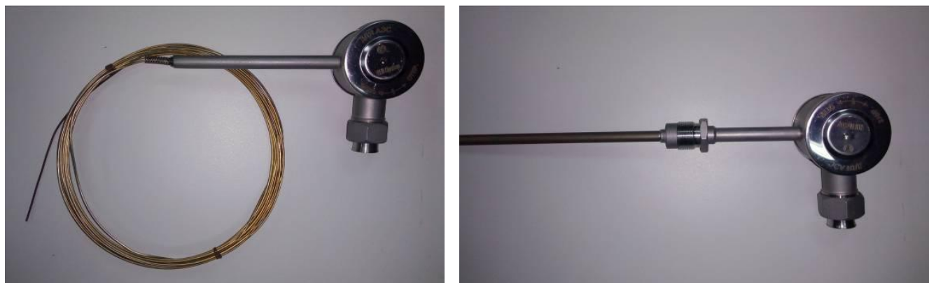
Рисунок 1 – Общий вид термопреобразователей с унифицированным выходным сигналом ТУС