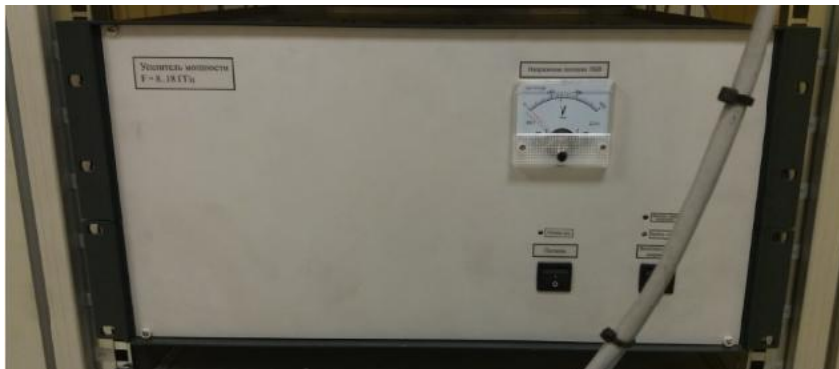
Рисунок 6 – Общий вид усилителя мощности диапазона частот 8-18 ГГц