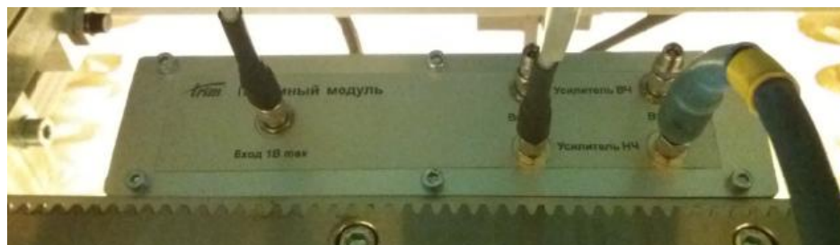
Рисунок 9 - Общий вид приемного модуля TRIM