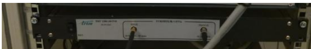
Рисунок 4 – Общий вид усилителя мощности диапазона частот 1-2 ГГц