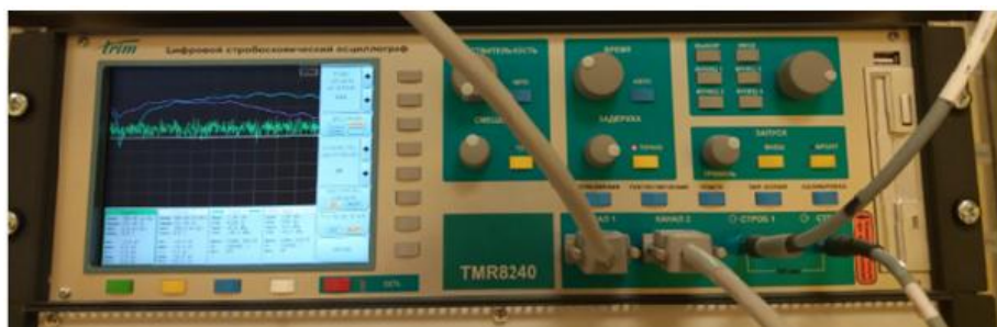
Рисунок 1 – Общий вид приемника сверхширокополосного TMR 8240

Схема пломбировки от несанкционированного доступа, обозначение места нанесения знака утверждения типа представлены на рисунке 2.