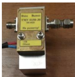
Рисунок 8 – Общий вид СВЧ малошумящего усилителя ТМУ 0140-30