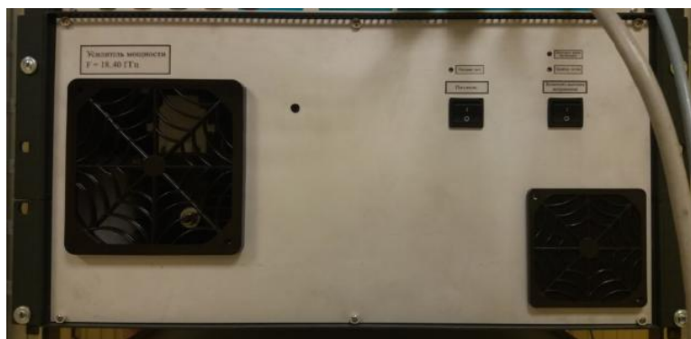
Рисунок 7 – Общий вид усилителя мощности диапазона частот 18-40 ГГц