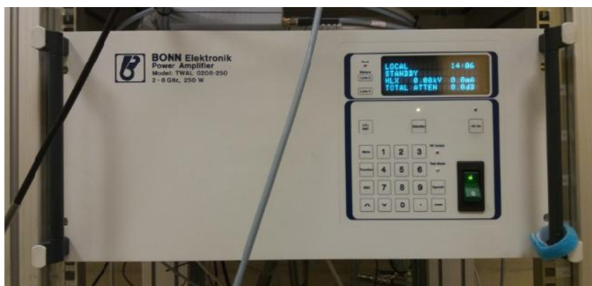
Рисунок 5 – Общий вид усилителя мощности диапазона частот 2-8 ГГц