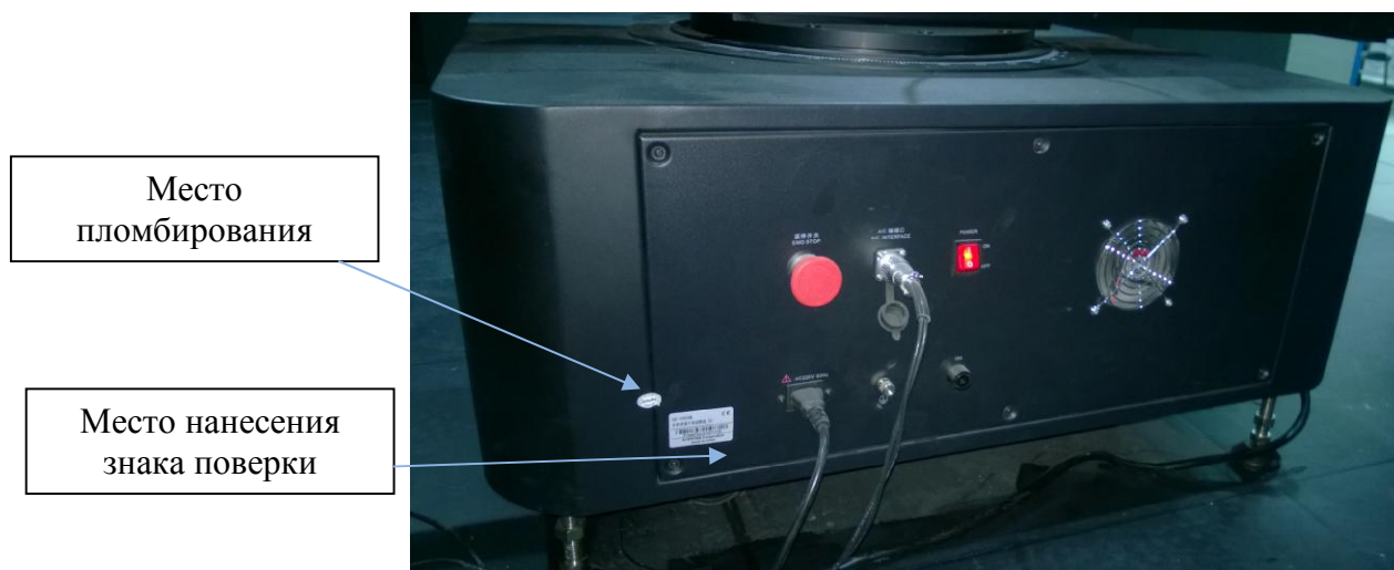
Рисунок 2 – Схема пломбирования от несанкционированного доступа, обозначение места нанесения знака поверки